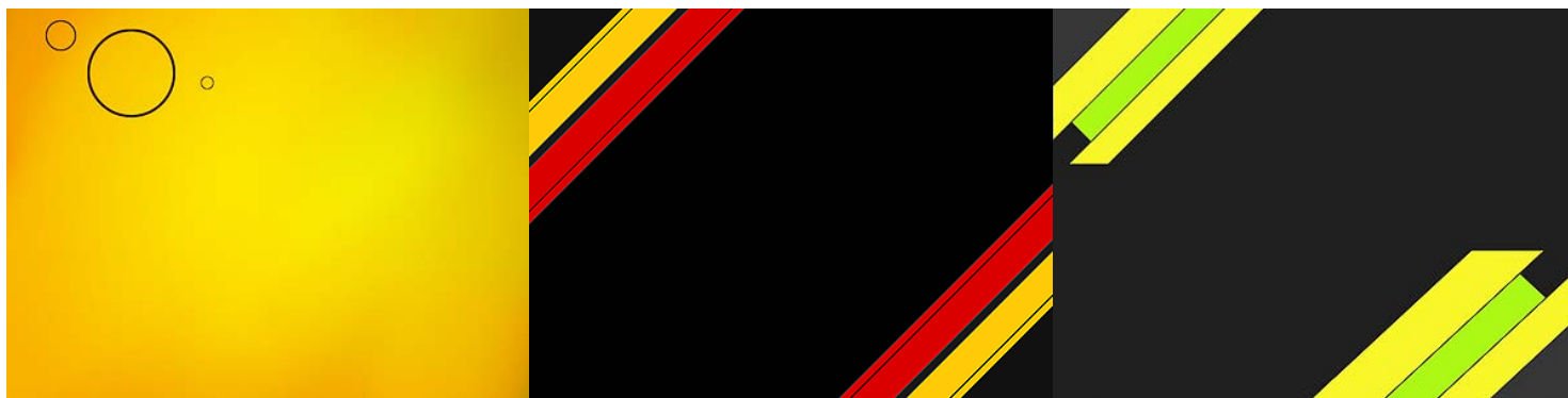
Thème 1 : Bullow