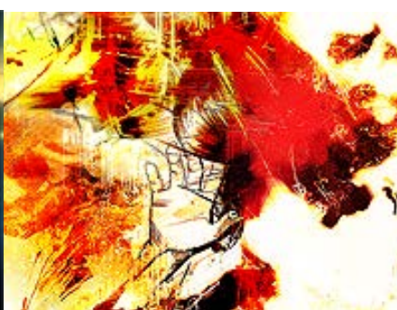
Thème 17 : Grungand